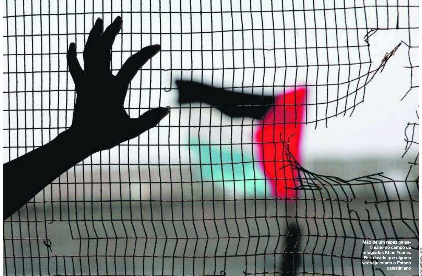
Mão de um rapaz palestiniano no campo de refugiados Khan Younis. Fisk duvida que alguma vez seja criado o Estado palestiniano

E porque acha que Israel ordenou o ataque à última flotilha? Primeiro, achavam que não iam encontrar resistência a bordo. Depois, tinham a esperança de encontrar material militar, coisa que rapidamente reconheceram que não havia. Contudo, o principal motivo é o que sempre move os serviços secretos de Israel: havia execuções que não faziam. Houve pessoas assassinadas na nuca. Muitas das autópsias que se realizaram em Istambul concluem que se trataram de execuções sumárias.